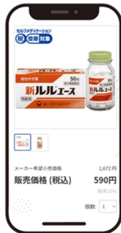
欲しい商品を カートに入れる