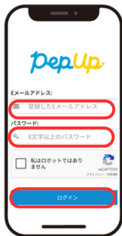
情報を入力しログイン