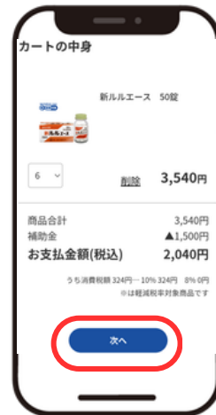
カートの中身から「次へ」