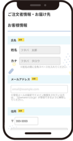
ご注文者情報を入力