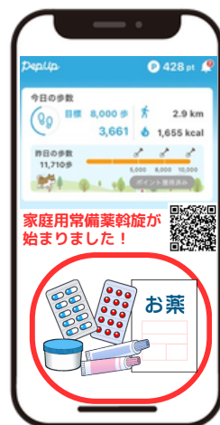
ホーム画面の枠内を クリック、またはQRを 読み込む