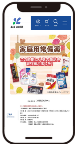
サイトへログイン