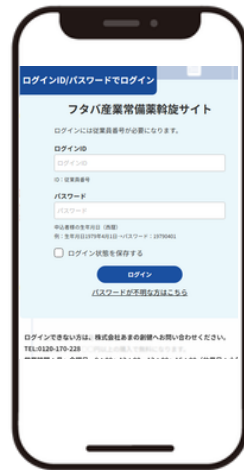
従業員番号 / 生年月日を入力