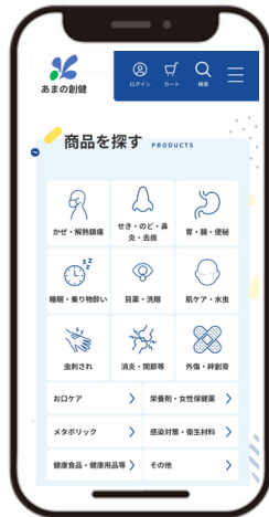
欲しい商品を検索